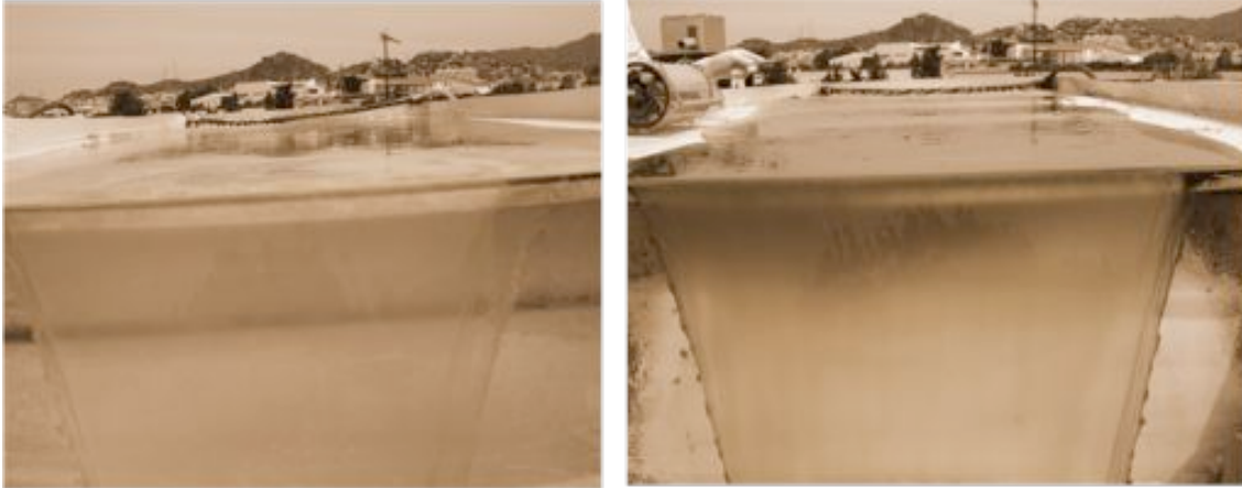
MEDIO CONVENCIONAL (CON ADICIÓN DE CO 2 )